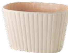
▽ Ghivece de ceramică cu model împletit sau cu pătrățele, 9 lei, de la Daiso ( www.daiso.ro ). Ghiveci bej din plastic poliuretanic, ușor și rezistent la îngheț, 33x50 cm, 129,95 lei, de la Ikea ( www.ikea.ro ).