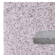
△ Dale gri deschis „Country”, aspect cribrură, 40x40 cm, 59,29 lei/m 2 ; bordură granit natural, 100x18x7 cm, 49,99 lei/buc. De la Bricostore ( www.bricostore.ro ).