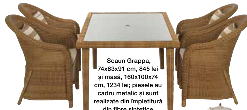
Scaun Grappa, 74x63x91 cm, 845 lei și masă, 160x100x74 cm, 1234 lei; piesele au cadru metalic și sunt realizate din împletitură din fibre sintetice rezistente la intemperii. www.mobexpert.ro