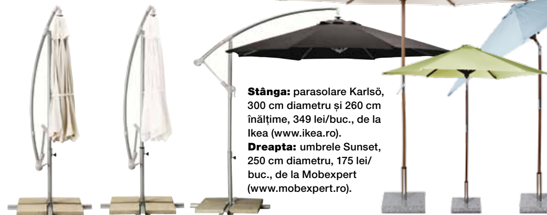
Stânga: parasolare Karlsö, 300 cm diametru și 260 cm înălțime, 349 lei/buc., de la Ikea ( www.ikea.ro ). Dreapta: umbrele Sunset, 250 cm diametru, 175 lei/buc., de la Mobexpert ( www.mobexpert.ro ).