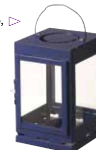
Felinar Lantställe, din oțel, cu suport pentru lumânare, 23 cm înălțime, 29,99 lei, de la Ikea ( www.ikea.ro ).