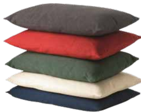
△ Pernele decorative Hällö, de 60x40 cm, în diverse culori, pot fi găsite la Ikea ( www.ikea.ro ), costă 39,99 lei bucata.