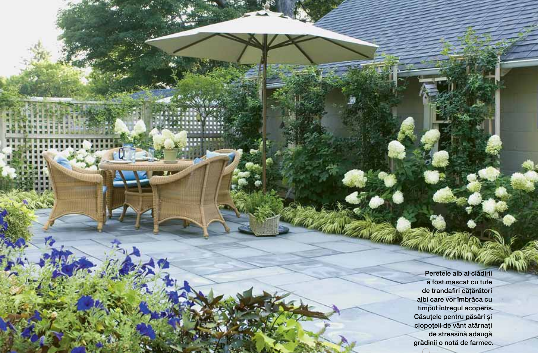
Peretele alb al clădirii a fost mascat cu tufe de trandafiri cățărători albi care vor îmbrăca cu timpul întregul acoperiș. Căsuțele pentru păsări și clopoțeii de vânt atârnați de streșină adaugă grădinii o notă de farmec.