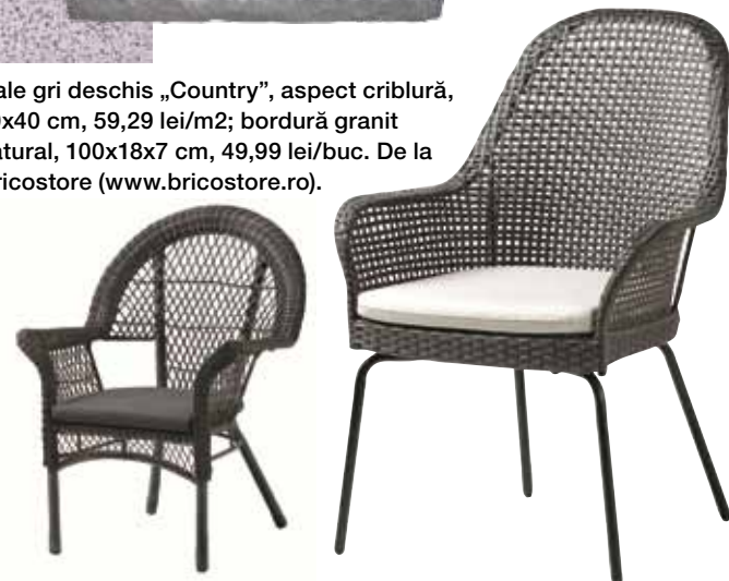
▽ Scaunele din ratan artificial, de la Ikea ( www.ikea.ro ), sunt rezistente la intemperii: scaun Läckö cu pernă gri, 349 lei; scaun Ammerö cu pernă bej, 299 lei. Pernele sunt incluse în preț!